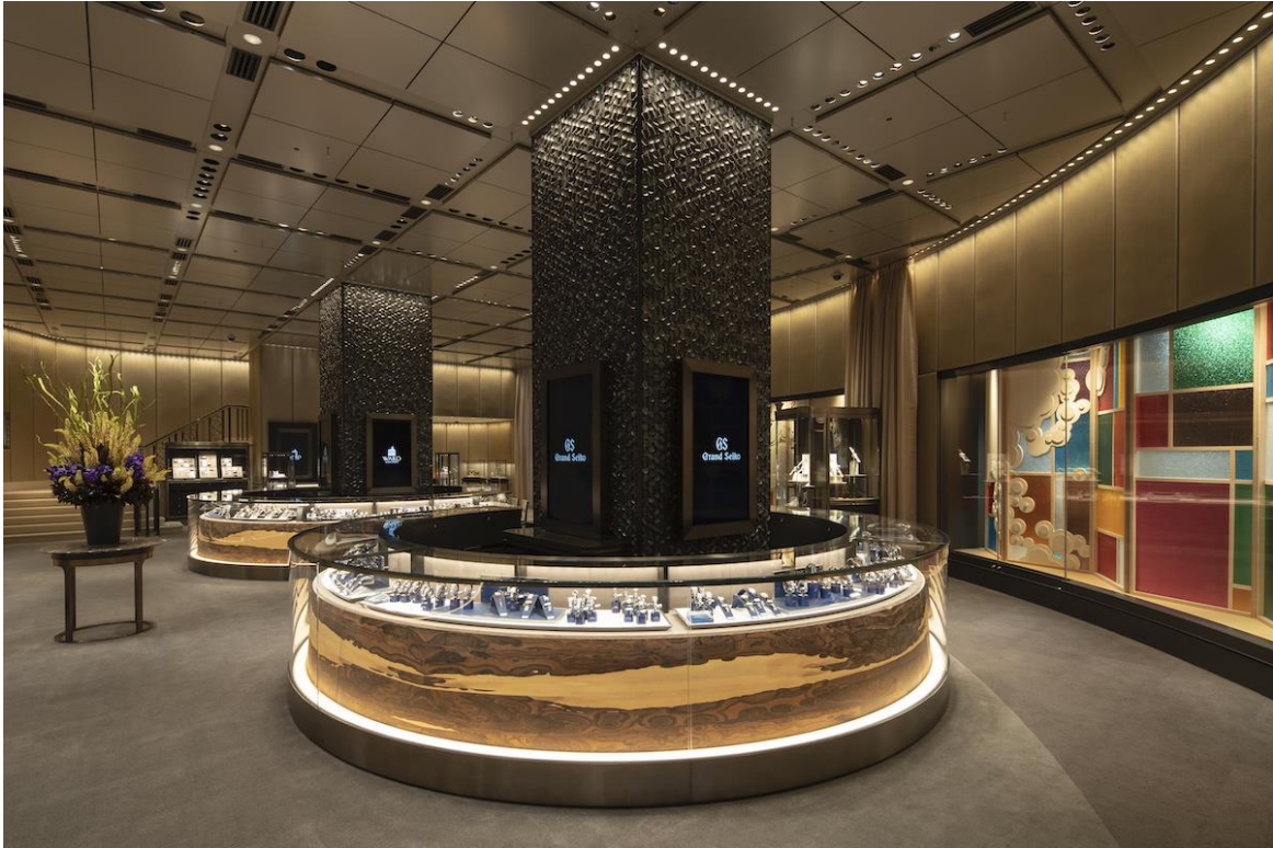
各ブランドの魅力を分かりやすく伝え、比較しやすいショーケースの配置

フルラインアップを取り揃えたグランドセイコー、和光限定モデルなども取り扱うクレドールをはじめ、セイコーウオッチは、国内随一の品揃えです。